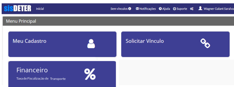
Menu Financeiro (acesso as Guias TFT).

Após a autenticação no sisDETER o usuário deve acessar o Menu Financeiro. Neste Menu serão visualizadas as Guias até então geradas pelo Sistema. Todo primeiro dia do mês é gerada a Guia para instituição com base nos veículos incluídos na DETER, (R$130,00) por veículo. O pagamento desta Guia deve ser realizado até o seu vencimento (dia 10 do mês corrente). Caso não tenha sido paga e o veículo da instituição for pego pela fiscalização, a instituição estará sujeita a penalidade instituída pela Lei 17.221, de 1º de agosto de 2017.